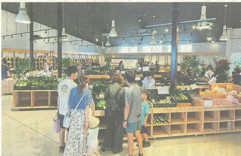
フモットマルシェ